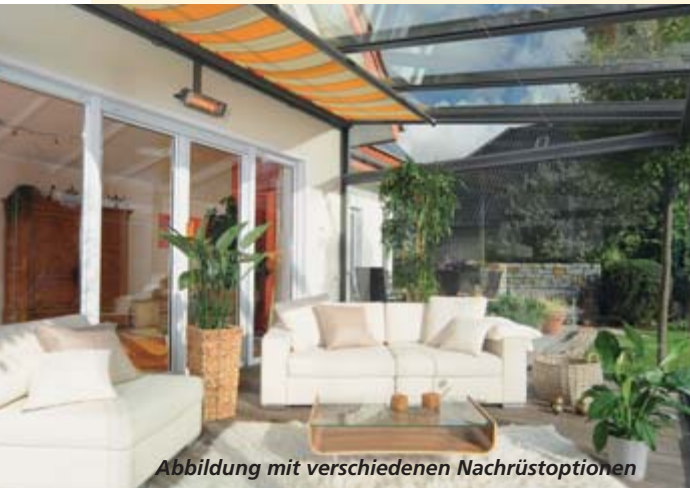
Abbildung mit verschiedenen Nachrüstooptionen