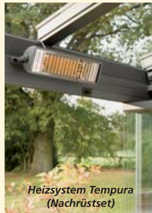
Heizsystem Tempura (Nachrüstset)